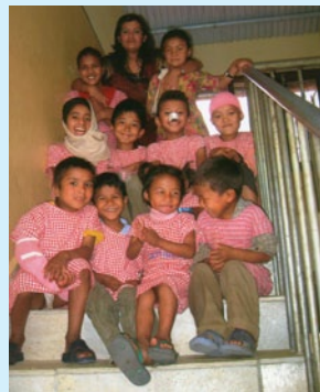
Kleine fröhliche Patienten sagen Danke!

Trotz der bisher erreichten großartigen Erfolge drückt uns die Sorge um die weitere Finanzierbarkeit dieses wunderbaren Projektes. Deshalb sind wir mehr denn je auf Ihre Hilfe angewiesen. Schon 150 Euro decken die Kosten einer Operation, die einem Menschen den Weg zurück in die Gesellschaft öffnet. Halten Sie uns deshalb weiter die Treue! Oder werden auch Sie Spender für das SKM-Hospital.