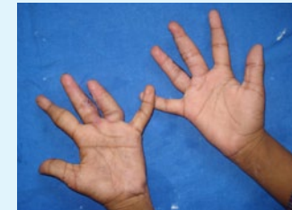
Syndaktylie: Adil Mansurs Hände vor und nach der Operation