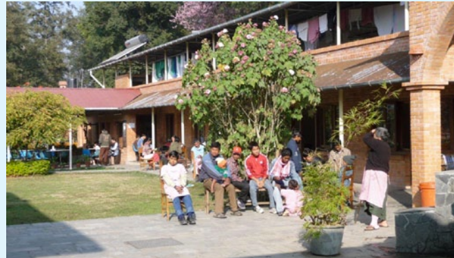
Wartende Patienten vor dem SKM-Hospital

Das Sushma-Koirala-Memorial-Hospital (SKMH) nahe Kathmandu will arme Menschen mit Verletzungen, Verbrennungsfolgen und Fehlbildungen medizinisch behandeln und ihre Lebenssituation verbessern. Dank unzähliger Spender, vieler ehrenamtlicher Helfer und einem engagierten Hospitalteam konnten in weit über 10 Jahren über 14.000 Operationen an mehr als 10.000 Patienten, meist Kindern, vorgenommen werden. Neben der plastisch-rekonstruktiven Medizin versorgt das Hospital die umliegende Bevölkerung auch allgemein- und zahnmedizinisch