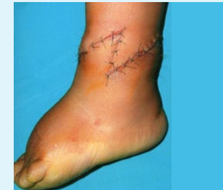
Fehlbildungen: Sujan Tapas Bein vor und nach der Operation